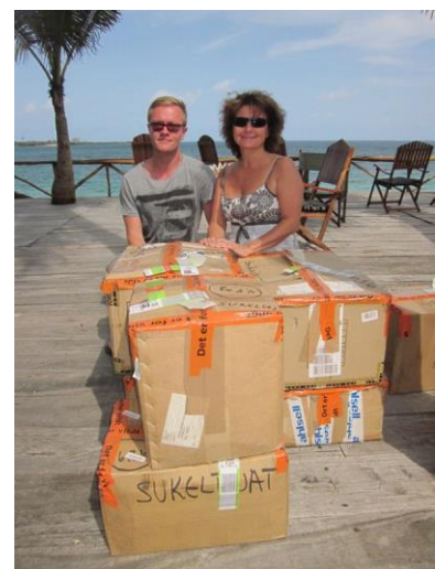
Liike lahjoitti laatikkokaupalla liikuntavälineitä eri kouluille ja opistoille Tansaniassa.

Hankkeen sisällä suunnitellaan yhä liikunnan ja terveystiedon opetuksen opetussuunnitelman uusimista Tansaniassa. Tavoitteena on että liikunnan opetuksen sisälle saadaan yksi viikkotunti terveystiedosta. Hanke evaluoitiin syksyllä 2014.