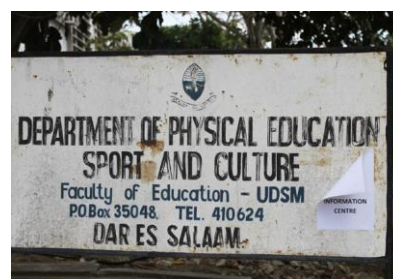
Pitääkö hankkeen maalata uusi opastaulu Dar es Salaamin liikuntatieteen laitokselle?