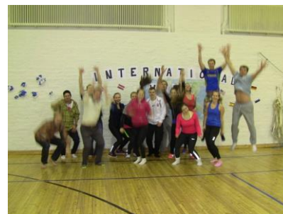
Vierumäen urheiluopiston opiskelijoita liikunnallisissa globaalikasvatusharjoituksissa