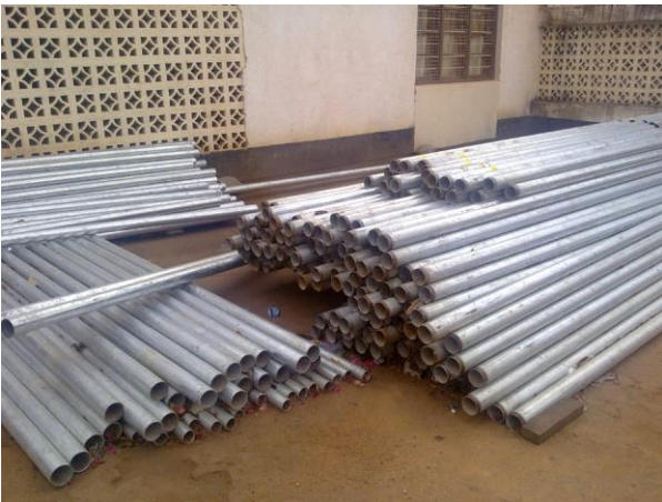
Maali- ja koripylyvää odottavat vain paikalleen asennusta Singidassa.

Yhteistyökumppaneina hankkeessa jatkoivat Singida Teachers' Union ja Sports Development Aid (SDA).